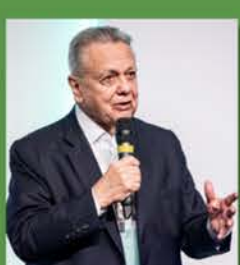
ROBERTO RODRIGUES EX MINISTRO DA AGRICULTURA