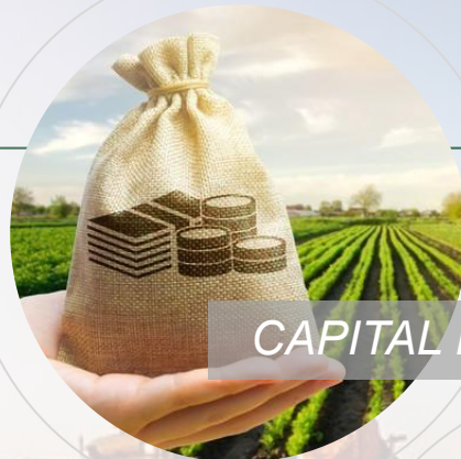
CAPITAL DE GIRO