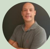
Renato Rodrigues Presidente da Rede ILPF e Pesquisador da Embrapa Solos