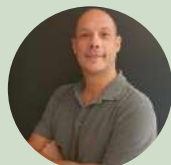
Renato Rodrigues Presidente da Rede ILPF